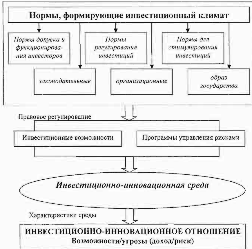
Рисунок 4 – Нормы инвестиционного климата