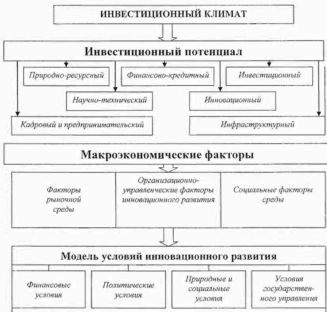
Рисунок 1 – Модель инвестиционно-инновационного развития

Большинство исследователей определяет инвестиционный климат как комплексную характеристику совокупности факторов – экономических, правовых, политических, социальных, культурных и даже идеологических, – определяющих привлекательность и целесообразность инвестирования в хозяйствующую систему. Таким образом, инвестиционный климат является объективной характеристикой отдельной экономической системы по ряду факторов (рис. 1).