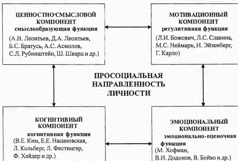
Рисунок 2 – Структурная модель просоциальной направленности личности

когнитивную функцию, мотивационный – регулятивную и ценностно-смысловую – смыслообразующую (рис. 2). Просоциальная направленность личности трактуется нами как устойчивая доминирующая ценностно-мотивационная система, отражающая глубинные смысловые структуры личности, включая мировоззрение человека и такое его отношение к действительности, как ориентированность на благо других людей без ожидания получения какого-либо внешнего вознаграждения.