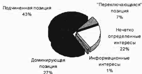
Рисунок 1 – Предпочтения мужчин-посетителей сайта

ключающимися» являются 155 человек (7%), с целью узнать информацию о BDSM зарегистрировалось 25 человек (1%) и нечетко определили свои предпочтения 495 человек (22%) (рис. 1).