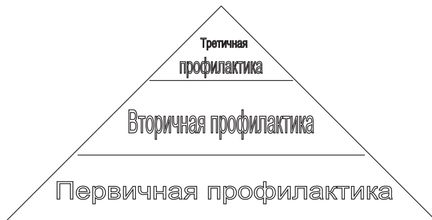
Рисунок 2 – Принцип охвата детей профилактическим влиянием

Согласно основополагающим принципам системного подхода, первичный, вторичный и третичный блоки профилактической работы рассматриваются как компо-