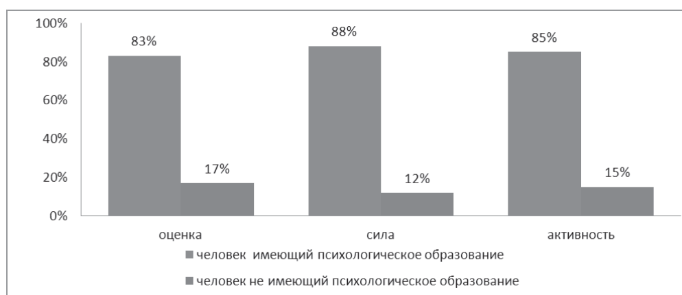
Рисунок 2 – Отличия человека, имеющего психологическое образование, от человека, не имеющего психологического образования

Чтобы понять, чем, в «глазах» испытуемого, простой человек без психологического образования отличается от психолога: черным цветом обозначаются качества человека, не имеющего и белым, имеющего психологическое образование. Получив среднее значение данных, строим диаграмму (рис. 2).