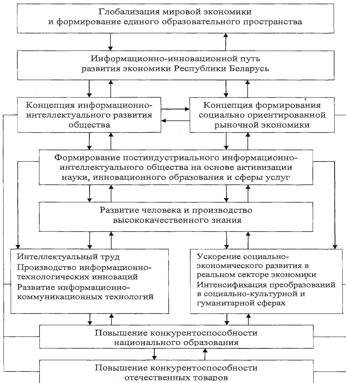
Рисунок 1. Компоненты и взаимосвязи модели информационно-интеллектуального развития экономики Республики Беларусь

Для достижения необходимого успеха белорусской экономике предстоит создать и реализовать концептуально новую модель информационно-интеллектуального развития, основанную на приоритетах знаний, информации, интеллектуального труда, использующую преимущества глобализации, информационно-технологические инновации в целях ускорения социально-экономического развития, интенсификации преобразований в социальной, культурной и гуманитарной сферах. Система взаимосвязанных компонентов новой модели информационно-интеллектуального развития национальной экономики Беларуси представлена на рис. 1.