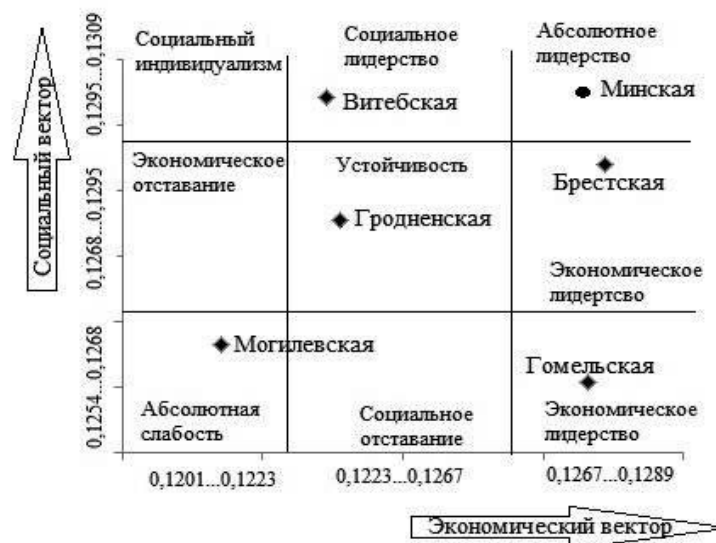
Рисунок 3 – Матрица «Конкурентоспособность предпринимательского сектора в регионах Республики Беларусь»

инвестиционно-инновационного, финансового и производственного блока), а по оси абсцисс – вектор «Социальный» (на основе интегральных экономических индексов: показатели социального блока) (рисунок 3).