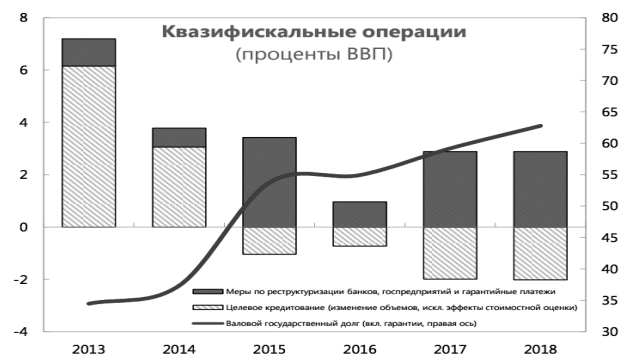
Рисунок 1 – Квазифискальные операции в Республике Беларусь в 2013–2015 гг., в % к ВВП

Кроме того, бюджетной системе Республики Беларусь присущи такие квазифискальные расходы, как исполнение государственных гарантий и рекапитализация банков и других государственных предприятий. Динамика квазифискальных операций Республики Беларусь в 2013–2015 гг. и прогнозные показатели на 2016–2018 гг. представлены на рисунке 1.