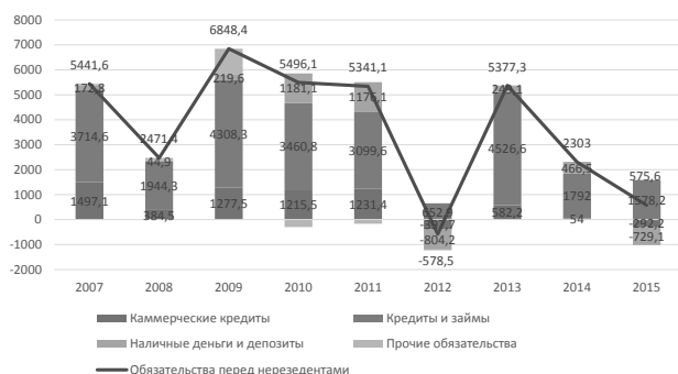
Рисунок 3 – Динамика изменения обязательств резидентов Республики Беларусь перед нерезидентами по разделу «Другие инвестиции» за 2007–2015 гг., млн долл. США

Динамика изменения обязательств резидентов Республики Беларусь перед нерезидентами по разделу «Другие инвестиции» за 2007–2015 гг. представлена на рисунке 3.