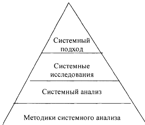
Рис. 1. Пирамида системной методологии

методики, которые основаны на известных подходах, но адаптируются для конкретной ситуации. В конечном счете методика системного анализа для определенного объекта является, как правило, оригинальной разработкой и научно значима. Особое внимание при проведении системного анализа уделяется процессу постановки задачи, поскольку для успешного решения необходимо корректно ее сформулировать. В ряде случаев анализ ограничивается 1-2 этапами, поскольку могут появиться достаточно очевидные решения. По мнению некоторых авторов, методики системного анализа для решения проблем в экономических системах применяются еще не часто, в ряде случаев это применение некорректно.