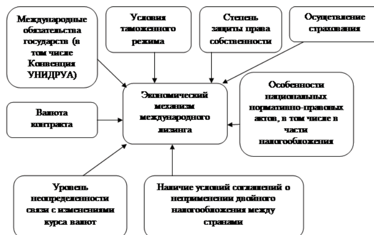
Рисунок 4 — Система факторов, формирующая экономический механизм международного лизинга