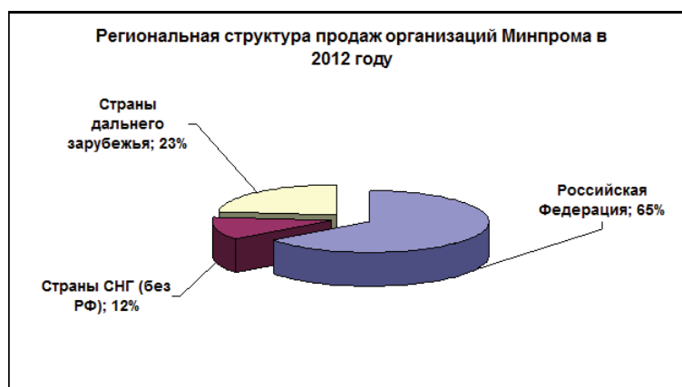
Рисунок 2 — Региональная структура продаж организаций Министерства промышленности в 2012 году