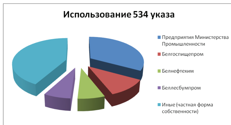
Рисунок 3 — Использования Указа № 534 предприятиями Республики Беларусь за 2013 год

Примечание: собственная разработка на основе [3].