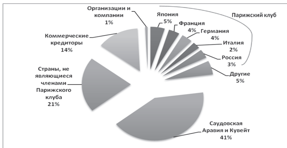
Рисунок 3 — Распределение иракского долга между странами

(до периода блокады), инвестиционные товары — 27 %, остальное приходилось на потребительские товары. Опасность заключается в открытой взаимозависимости между секторами экономики и иностранными делами. Это происходит из-за слабой экономической структуры, потому что не было значительных связей между национальными секторами экономики. Например, в 1988 году импорт товаров, используемых в производственном секторе, составил 53 % от общего использования в этом секторе, однако в остальных 47 % местных товаров этого же сектора также имеется доля импортных ресурсов.