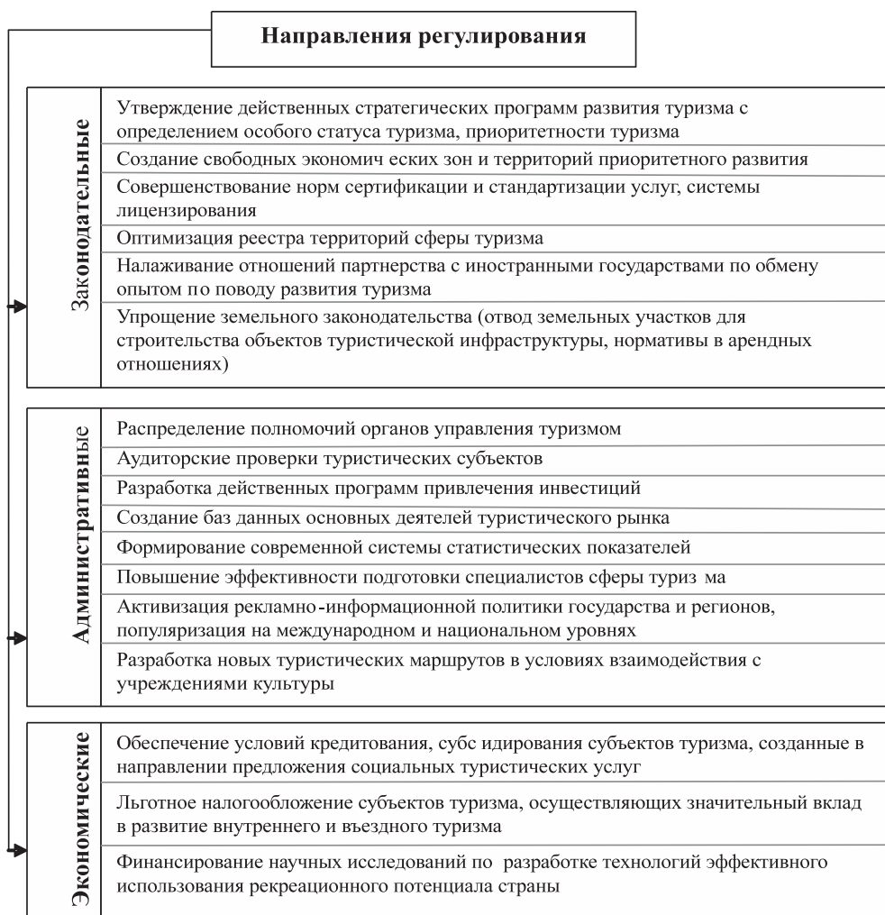
Рисунок 2 — Направления государственного регулирования территориальных рекреационных комплексов

ных рекреационных комплексов. Если сегментировать направления регулирования территориальных рекреационных комплексов со стороны государственных и местных органов власти, то можно выделить три основные группы рычагов влияния. Наглядно данные показатели изображены на рис. 2.