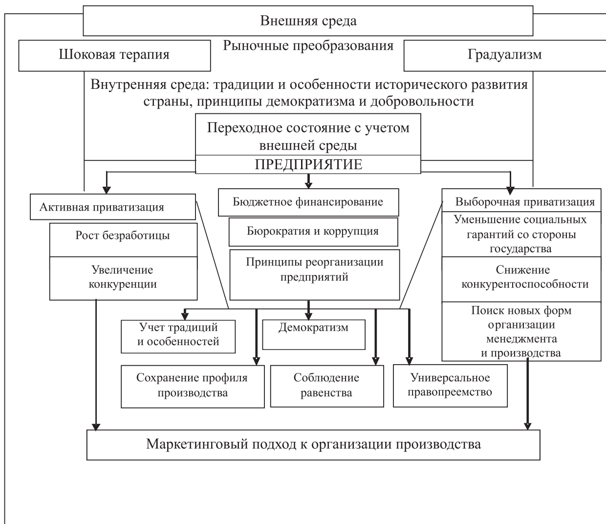
Рисунок 1 – Модель преобразования производственных отношений в Республике Ирак

На основании имеющихся подходов к реформированию переходной экономики и анализа производственно-организационных форм, функционирующих в народном хозяйстве стран с переходной экономикой, в частности, в Республике Ирак, построим модель по преобразованию производственных отношений и формированию новой структуры хозяйствования, основанной на принципах учета традиций и особенностей страны, демократизма и добровольности, универсального правопреемства, сохранения профиля производства, сохранения равенства и социальной справедливости (рис. 1).