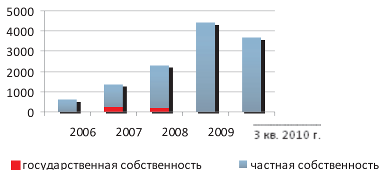
Рисунок 2 – Прямые иностранные инвестиции по формам собственности