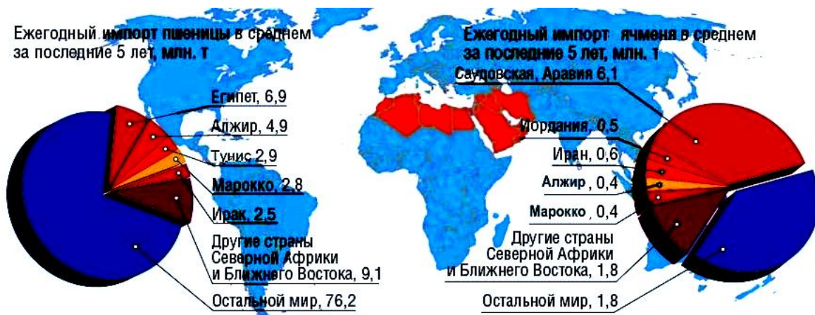
Рисунок 2 – Ежегодный импорт зерновых в страны Северной Африки

Приведенные цифры говорят о том, что рынки северной Африки до сих пор остаются недостаточно освоенными нашими экспортерами с точки зрения продвижения на них основных экспортных товаров – продукции предприятий машиностроения, электронной и нефтехимической промышленности. В то же время потенциально государства Африки могут считаться едва ли не самыми емкими, вслед за странами СНГ, рынками для наших автомобилей, тракторов, станков, подшипников, химических волокон, электронных и медицинских приборов. Нельзя забывать и о существующих возможностях для сбыта холодильников и других товаров бытового назначения, стройматериалов, изделий деревообработки. Исходя из этого оказание поддержки белорусским экспортерам именно данной продукции (при сохранении высокого уровня поставок традиционных товаров) в настоящее время является одним из приоритетов торгово-экономической деятельности МИД и наших загранучреждений. Свою роль при этом Министерство видит прежде всего в оказании белорусским предприятиям информационного, политического и организационного содействия (рис. 2).