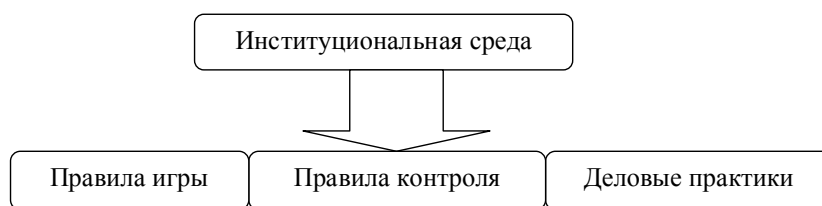
Рисунок 1 – Схема институциональной системы

Правила игры и контроля реализуются через деловые практики, т.е. реальные события деловой жизни (рис. 1).