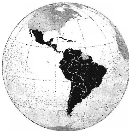
Рисунок 1 – Страны Латинской Америки

Уже около двадцати лет поддерживаются дипломатические отношения между Республикой Беларусь и ведущими странами Латинской Америки. На сегодняшний день Беларусь поддерживает дипломатические отношения с 27 из 33 стран региона. Развитие отношений Беларуси со странами Латинской Америки и Карибского бассейна по различным направлениям призвана обогатить многовекторность и сбалансированность белорусской внешней политики.