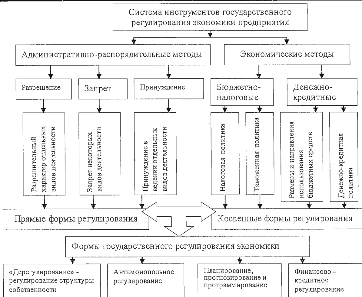
Рисунок 2 – Инструменты системы регулирования экономики предприятия

В системе мер государственного регулирования экономики в научной литературе выделяют относительно самостоятельные, но тесно увязанные формы: планирование, прогнозирование и программирование; финансово-кредитное регулирование; антимонопольное регулирование; дерегулирование экономики. Антимонопольное регулирование экономики является одним из основных инструментов, создающих условия конкуренции и развития конкурентной среды. Под формой «дерегулирование» подразумевается введение процессов разгосударствления и приватизации. Как уже нами подчеркивалось в [5], такое название одной из форм государственного регулирования не очень удачно. Приставка «де» означает отсутствие, отмену, устранение или движение вниз, понижение. Эту форму следует назвать «государственное регулирование структуры собственности» и подразумевать не только приватизацию, но и государственную поддержку малого и среднего бизнеса в стране. Именно