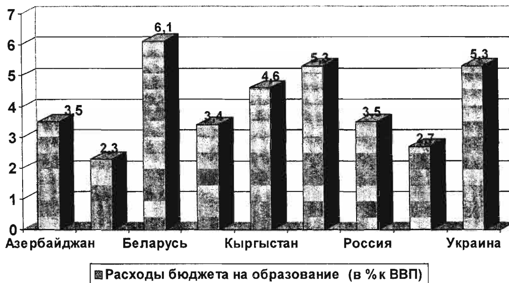
Рис. 2. Расходы консолидированного бюджета на образование и профессиональную подготовку по странам СНГ (в % к ВВП)

последним опубликованным данным в США, Германии, Норвегии расходы бюджета на образование составляли примерно 5,5% ВВП, в Канаде, Франции, Швеции – 7% [1].